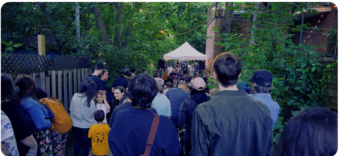
Show de ruelle, Petite Marquette, 2024

Chez nous, l'idée des shows de ruelle est apparue lorsque nous sommes allé-es voir notre amie pianiste qui se produisait dans une petite ruelle d'Hochelaga. C'était tout simple : un piano, un ampli, des vieilles dames qui offraient du vin à tout le monde sous un beau soleil d'après-midi. Chaque personne n'avait qu'à apporter sa chaise ! Cela nous a paru si facile que nous avons importé le concept derrière chez nous, avec un tabouret, un micro et une guitare !