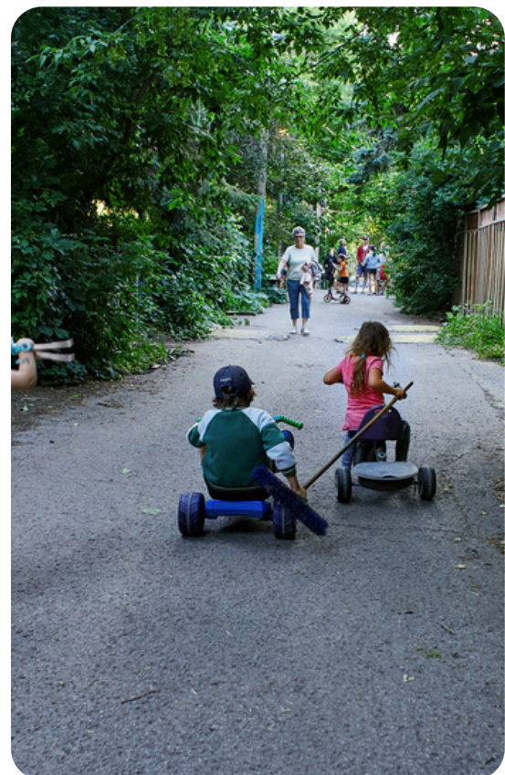
Ruelle place au soleil, 2024

Il faut qu'il y ait non seulement assez d'espace pour la scène, mais pour laisser un petit corridor où les gens pourront passer sans risquer de heurter les instruments.