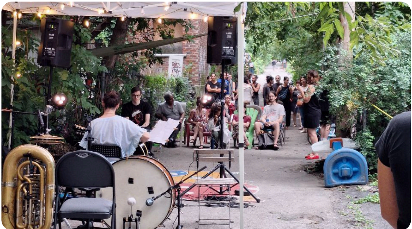
Show de ruelle, 17 août 2024

Si votre espace de prédilection nécessite de bloquer le stationnement d'un voisin, assurez-vous de lui demander la permission et de le ou la prévenir bien à l'avance afin qu'il ou elle sorte sa voiture et la stationne dans la rue !