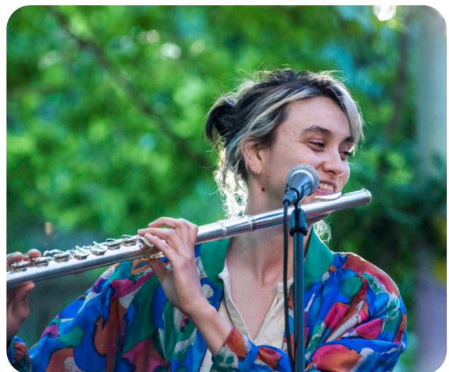
Show de ruelle, Petite Marquette, PPP 2024