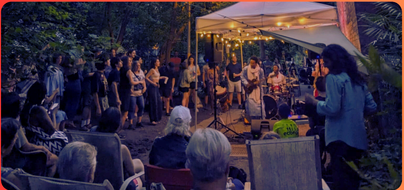
Show de ruelle, Petite Marquette 2023

UN GUIDE PRATIQUE PRÉSENTÉ PAR LE PROJET PARTICIPATIF CITOYEN :