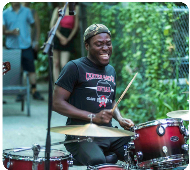
Show de ruelle, Petite Marquette, 2024