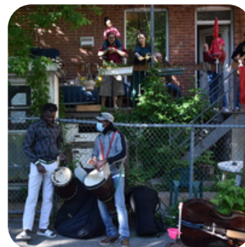
Rassemblement de voisin-es, ruelle place au soleil, 2020