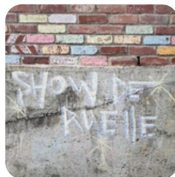
Marquage au mur, ruelle place au soleil, 2020