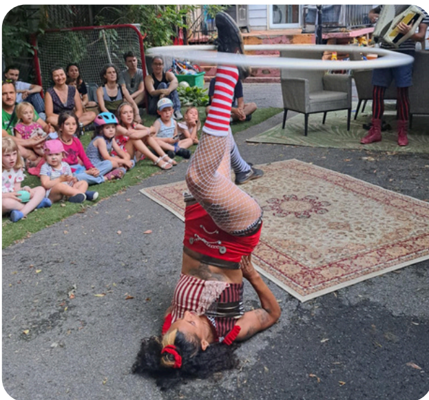
Show de ruelle, Petite Marquette, 2024

Ne vous inquiétez pas, vous n'êtes pas non plus obligé-e d'être abonné-e à trois magazines et de passer des nuits blanches en ville une fois par semaine! On peut se contenter de peu: Montréal est une ville bourrée de talent. Les artistes de qualité débordent dans le milieu alternatif et underground et ne demandent qu'à avoir des opportunités de se produire !