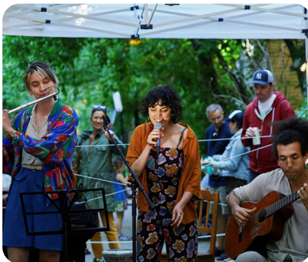
Show de ruelle, Petite Marquette, 2024

S.E. Concept , est un petit commerce familial qui se spécialise dans la sonorisation et l'éclairage, et il propose la vente, mais aussi la location de matériel professionnel à des prix raisonnables (et des conseils!). Ça vaut le coup d'y jeter un œil.