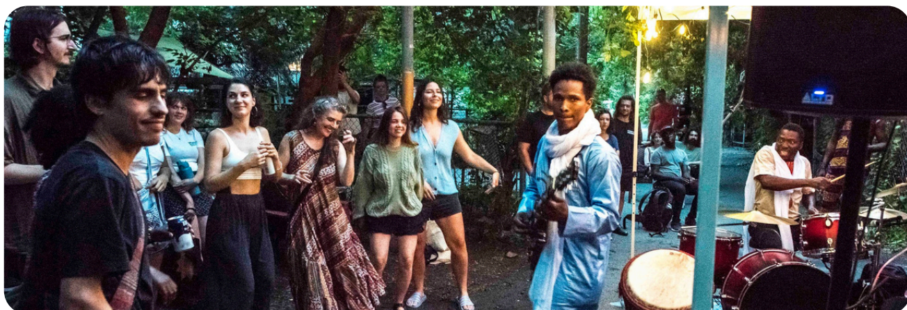
Show de ruelle, Petite Marquette, 2024, PPP

Restez à l'affût des programmes offerts par votre arrondissement. Vous pouvez également approcher des organismes communautaires ou culturels proches de vous. Ou même les sociétés de développement commercial. Informez-vous sur les programmes ou bourses pour des projets citoyens.